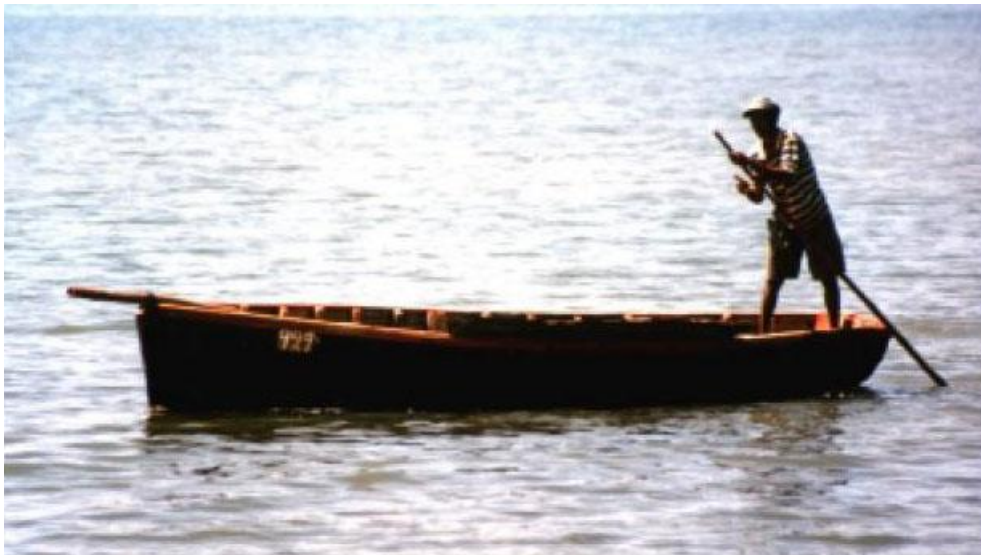
Träbåt på Mauritius

Mina två vänner lyfte båten som jag satt i över revet. Det skrapade i båtens botten. Det var en träbåt och båten var deras livsnödvändighet, så jag förstod att situationen var mycket allvarlig eftersom de utsatte båten för detta. De lyfte båten över till lagunen och simmade för att få fart på den. Jag sa: "Följ med mig!" Men de svarade: "Nej, det blir för tungt, ta med den unga grabben så hjälper han dig i land." Pojken drev fram båten med en lång stav.