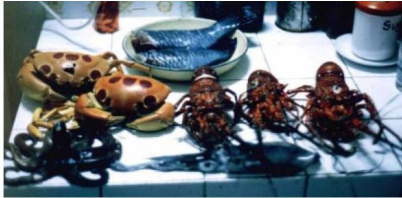
En vanlig fångst på Mauritius

När jag njöt med surfandet vid Tamarin-revets snabba vågor hade jag gjort slut på mina pengar. Därför drog jag iväg till Syd Afrika där jag fick ett jobb som instruktör i vindsurfing och vattenskoter. Helt otroligt att jag fick betalt att göra detta! Jag surfade vid Jeffreys Bay och Elands Bay och besökte några av världens mest fantastiska djurreservat.