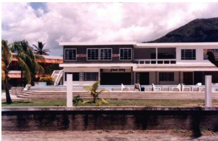
Tamarin Bay Hotel

Ambulansen anlände. Den kom in på parkeringen med påslagna sirener och blinkande lampor, gjorde en u-sväng framför hotellet och körde vidare. Ambulansföraren var från ett sjukhus för svarta, när ingen väntade på ambulansen vid Kineshotellet trodde han förmodligen att han fått fel information.